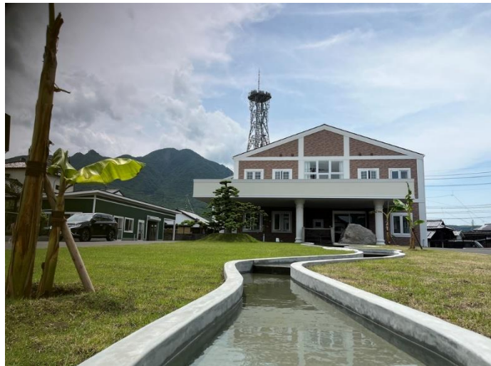
アステップ（島原拠点施設内）